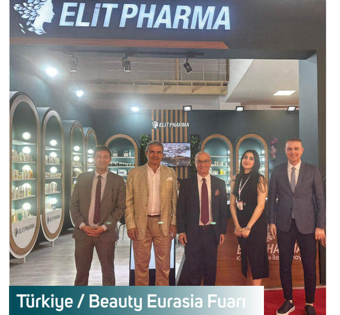
Türkiye / Beauty Eurasia Fuarı