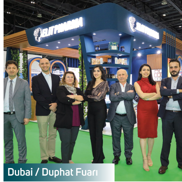
Dubai / Duphat Fuarı