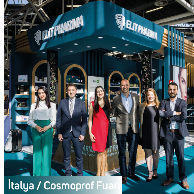
İtalya / Cosmoprof Fuarı