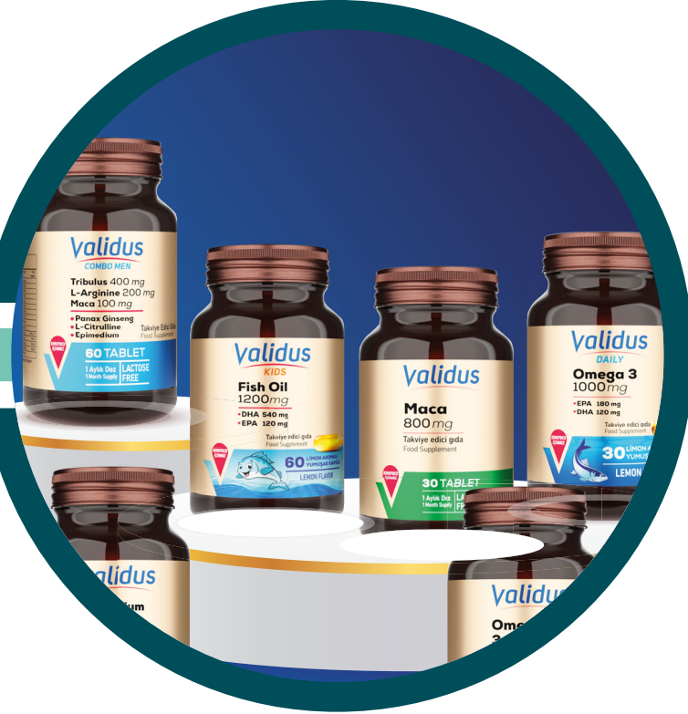
Takviye Edici Gıda