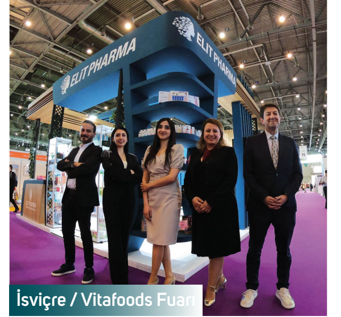
İsviçre / Vitafoods Fuarı